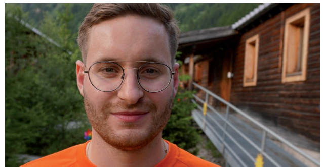
Joël Kalbermatten / Springer